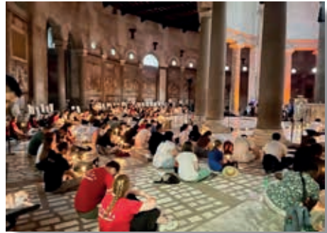
▲ Taizégebet in Kirche Santo Stefano Rotondo